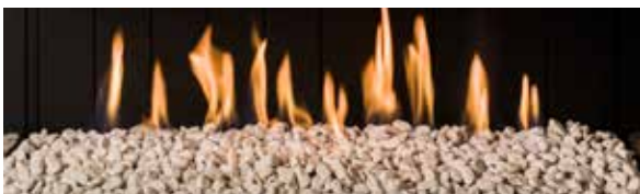
Carrara (opcional) / Carrara (optional)