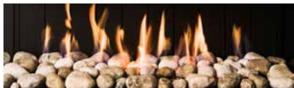
Guijarros (opcional) / Pebbles (optional)