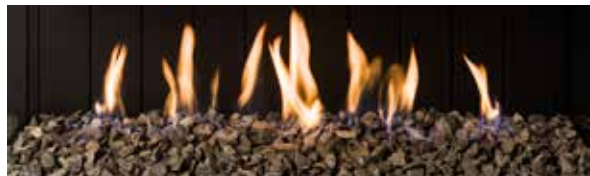
Basalto (opcional) / Basalt (optional)